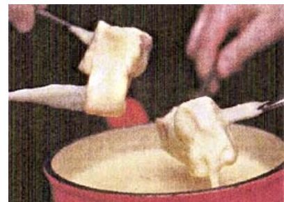
Kostprobe : Jedes Fondue mit anderer Duftnote