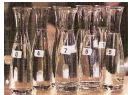
Blindverkostung : Die acht „Kandidaten“