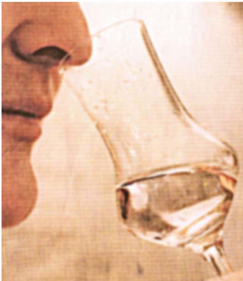
Riechprobe : klare Unterschiede in der Nase

Fazit: Die Fonduerezepte müssen neu geschrieben werden. Denn was pur gefällt, muss nicht zwangsläufig im Käse schmecken. Und umgekehrt: Was beim Essen den Gaumen kitzelt, sollte nicht unbedingt pur dazu getrunken werden. Besser ist, den optimalen Kirsch zur Käsemischung zu finden und sich als krönenden Abschluss einen anderen grossen Brand zu gönnen. Die Schweiz hat mehr davon zu bieten, als der Fonduefan in der Saison geniessen kann.