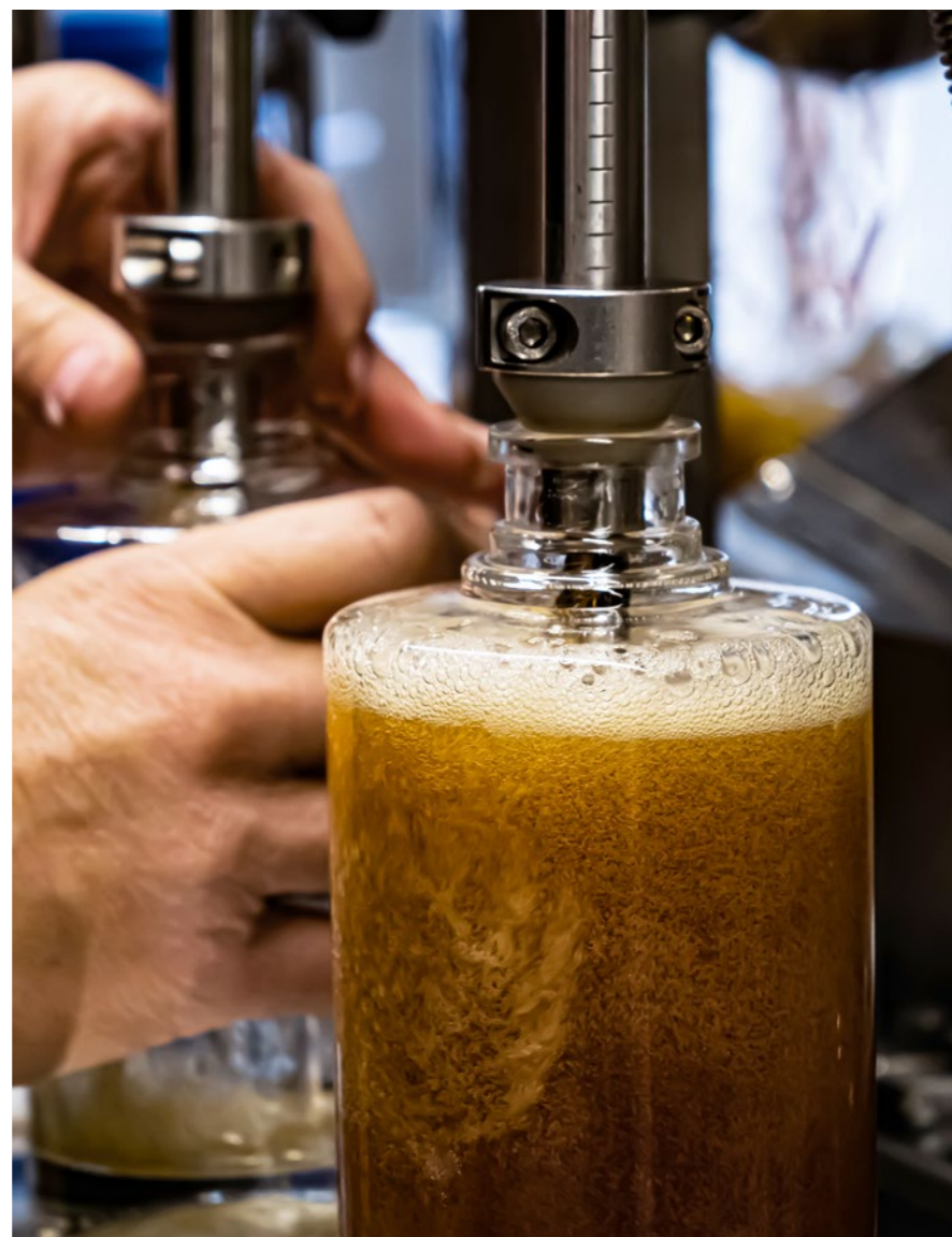
Whiskyabfüllung bei Langatun

konsumieren. Andererseits der Langatun «Old Crow» ein rauchiger, torfiger Whisky. Das Gerstenmalz dieses Single Malt Whiskys wird speziell mit Torf geräuchert. Das heisst, dass beim Mälzvorgang die Gerste mit Rauch von verbranntem Torf getrocknet wird, wobei diese das Raucharoma aufnimmt, was dann dem fertigen Whisky die typische Rauchigkeit verleiht. Er gehört zu den ersten Whiskys der Schweiz, ja sogar zu den ersten Whiskys des europäischen Festlands, welcher mit diesem Verfahren hergestellt wurde. › Goldwaescher Pure Rye Whisky Virgin Oak, von der DIWISA AG in Willisau ist eine weitere Whisky-Spezialität aus der Schweiz. 100 Prozent Schweizer Roggen, in kleinen Chargen destilliert. Im Lagerhaus den wechselnden Temperaturen ausgesetzt, in neuen, ausgebrannten Schweizer Eichenfässern gereift. Drei Jahre im Fass entlocken dem Goldwaescher sein kräftig-würziges Aroma, mit Nuancen von Röstaromen und feiner Süsse. Ein Rye Whisky mit eigenem Charakter. › Dank ambitionierter Quereinsteiger mit der Liebe zum Whisky, welche aus branchenfremden Unternehmern zu Brennern des edlen Destillats werden, entstehen wahre