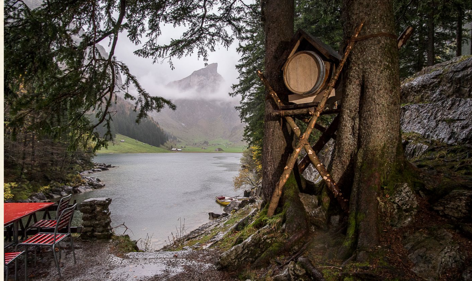
Säntis Malt Whisky Trek Appenzell

*nur für Firmenkunden, nur 1 Probierpaket pro Betrieb